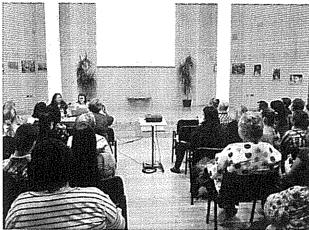
Szakmai nap, 2019. június 5. Bács-Kiskun Megyei Katona József Könyvtár Kecskemét