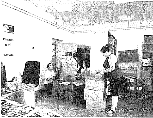
Könyvtári állomány lepakolása, bedobozolása