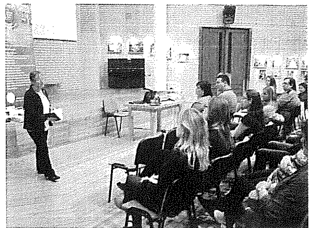
Szakmai nap, 2019. november 4. Bács-Kiskun Megyei Katona József Könyvtár Kecskemét